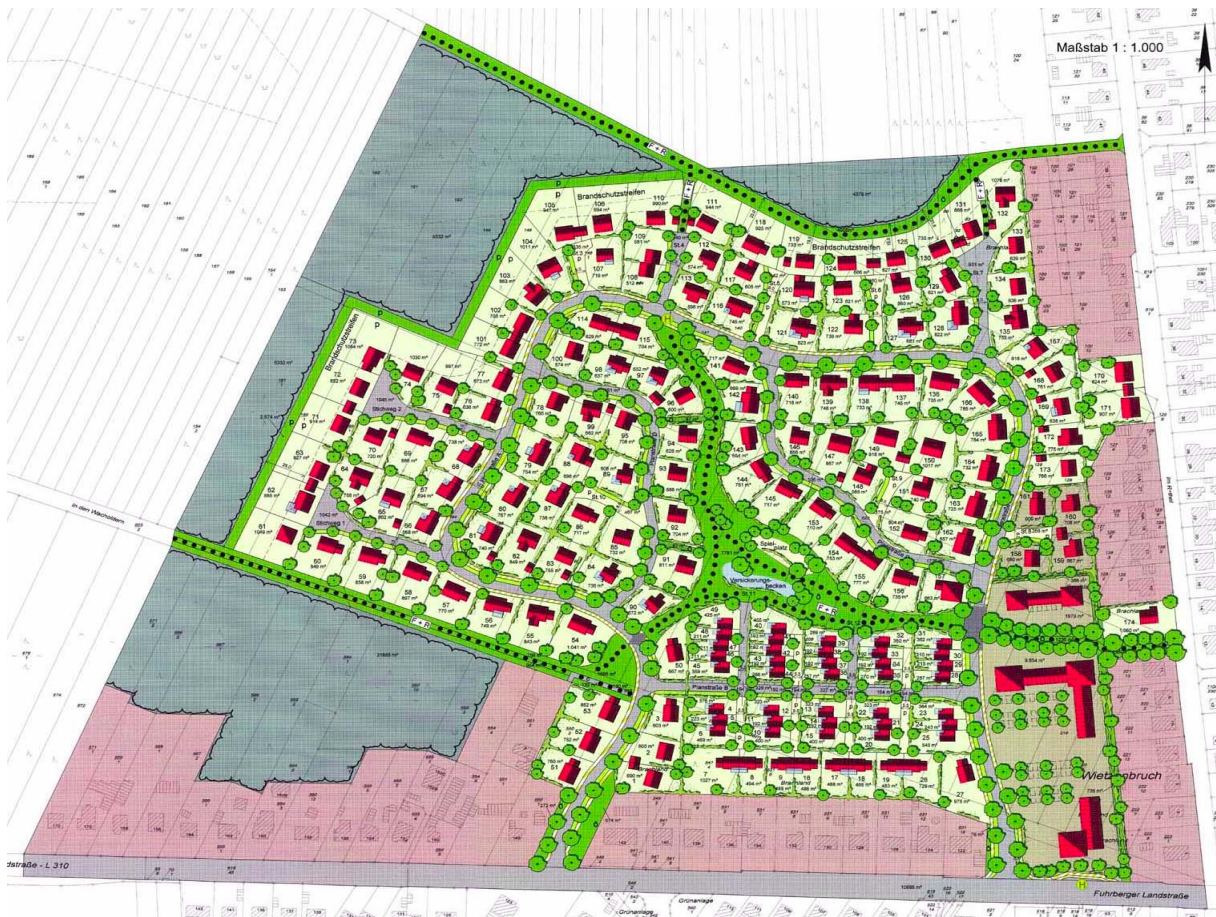
Abb. 1: Bebauungsplan

Das Bebauungsgebiet Wietzenbruch befindet sich im süd-westlichen Teil der Stadt Celle. Es bildet eine Fläche von ca. 20 Hektar, auf denen sich später einmal 152 bebaute Grundstücke verteilen sollen (Abb. 1).